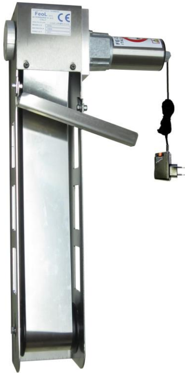
LE DESHUIEUR FEOL MAXI INOX 400