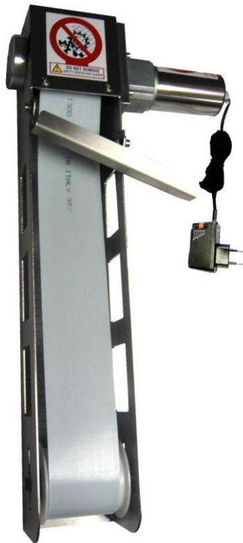
LE DESHUIEUR FEOL MAXI 400