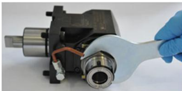
La seconde bloque ou débloque l'adaptateur