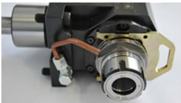
La première clé bloque la broche

Ce nouveau mécanisme est désormais étendu à toute la gamme MT de porte-outils non équipés en changement rapide.