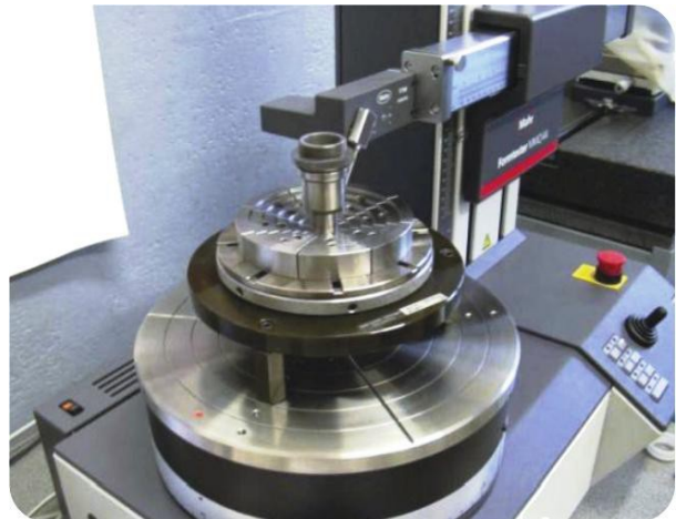
Arbre MT AVEC revêtement en céramique