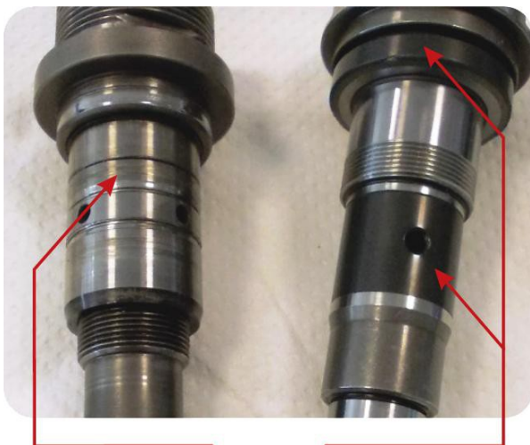
Arbre de la concurrence sans revêtement en céramique